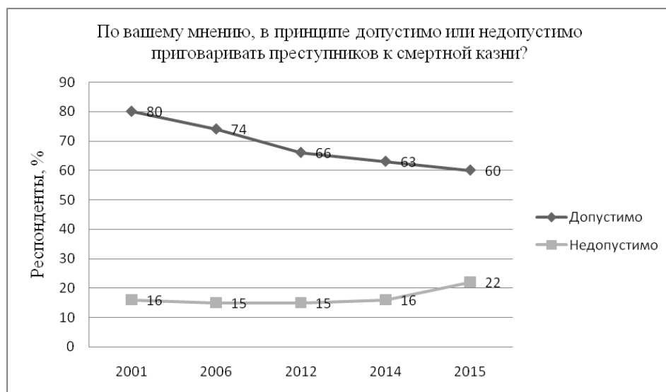
Рис. 1. Распределение ответов на вопрос о допустимости вынесения смертных приговоров преступникам по данным фонда «Общественное мнение» (выборка 1 500 респондентов) [3]

При общей гуманизации позиции россиян по вопросу о принципиальной возможности вынесения смертных приговоров примерно половина респондентов высказалась за отмену моратория и возвращению к практике применения смертной казни.